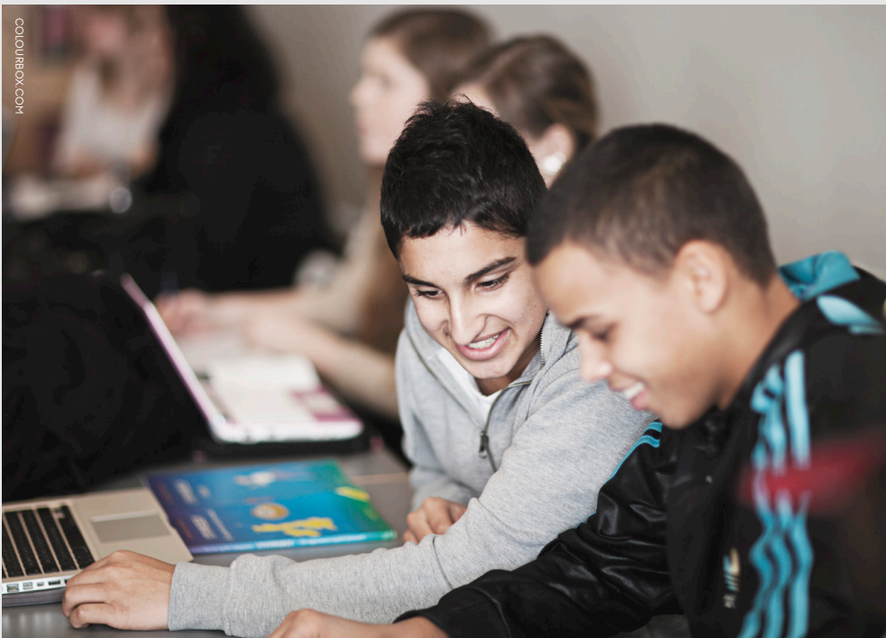
Forskning peger på, at modersmålsundervisning kan give tosprogede elever bedre dansk kundskaber.

de fleste elever. For når kommunerne ikke er forpligtede på det, signalerer man fra Christiansborg, at modersmålsundervisningen er unødvendig. Og hvorfor skulle kommunerne så bruge penge på den?