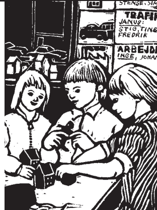
Illustration af Thomas Kruse fra bogen 'En nødvendig pædagogik'